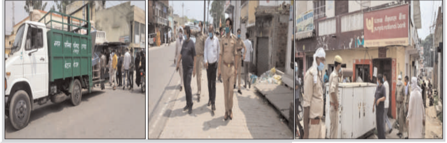
नगर में थाने के सामने नगरपालिका द्वारा शौचालय पर गंदगी देख मड़के अधिशासी अधिकारी, सफाई कर्मचारियों को लगाई फटकार